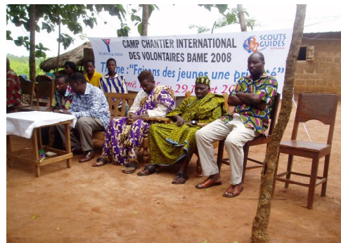
Les leaders communautaires président le lancement du camp

Lors du camp de juillet les jeunes de l'UCJG qui ont participé au camp ont organisé des activités de soutien scolaire. En effet vingt trois jeunes animateurs et campeurs venus de France et du Togo et logés dans les familles de la communauté ont pu encadrer quatre vingt dix-neuf (99) enfants de Bamé et villages environnants pendant 10 jours. Ils ont aidé ces enfants à faire des révisions et des exercices en français et mathématiques. Parmi ces enfants dont l'âge varie de 4 à 17 ans, certains manquent de certificat de naissance. C'est pourquoi les campeurs ont pu aider les parents à s'organiser pour adresser une demande collective d'établissement d'actes de naissance au tribunal de Kevé.