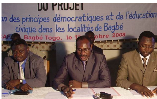
Le Ministre des Droits de l'Homme (au centre) prononçant le discours de lancement

Par ailleurs l'UCJG se propose de mobiliser des ressources pour former les jeunes citoyens édificateurs de la paix en vue de renforcer les acquis du projet en cours pour plus de citoyenneté, tolérance et la pacification des relations dans les communautés. Un forum des jeunes pourra contribuer à cet objectif.