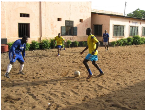
Les activités sportives permettent aux détenus de garder la forme, d'avoir un bon mental et de se mettre en valeur

Une leçon apprise est que la question de la justice juvénile est nouvelle pour les populations mais se révèle très préoccupante pour elles. C'est pourquoi une nouvelle formulation de la campagne est indiquée. Un atelier de formation pourra améliorer la capacité des jeunes engagées sur le projet. En perspective la campagne se poursuivra avec un plaidoyer qui impliquera davantage de jeunes.