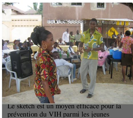
Le sketch est un moyen efficace pour la prévention du VIH parmi les jeunes

Il convient de bien entretenir ce partenariat afin de donner davantage d'opportunité aux jeunes de la communauté à continuer à se former pour des changements dans la communauté.