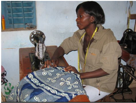
Jeune fille en réinsertion elle passe son examen profession en avril 2009

Une leçon apprise est que la question de la justice juvénile est nouvelle pour les populations mais se révèle très préoccupante pour elles. C'est pourquoi une nouvelle formulation de la campagne est indiquée. Un atelier de formation pourra améliorer la capacité des jeunes engagées sur le projet. En perspective la campagne se poursuivra avec un plaidoyer qui impliquera davantage de jeunes.