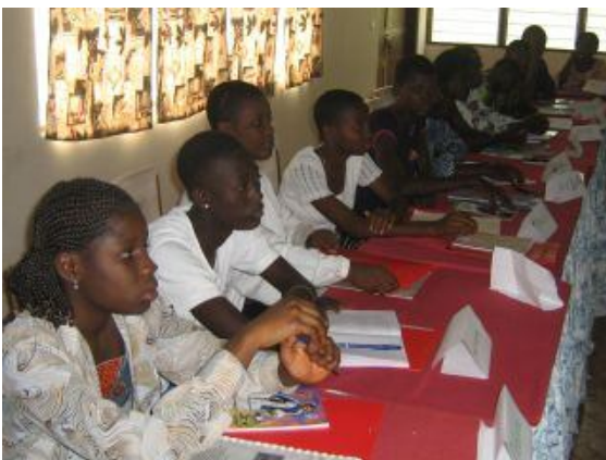
Atelier de recyclage des PEs