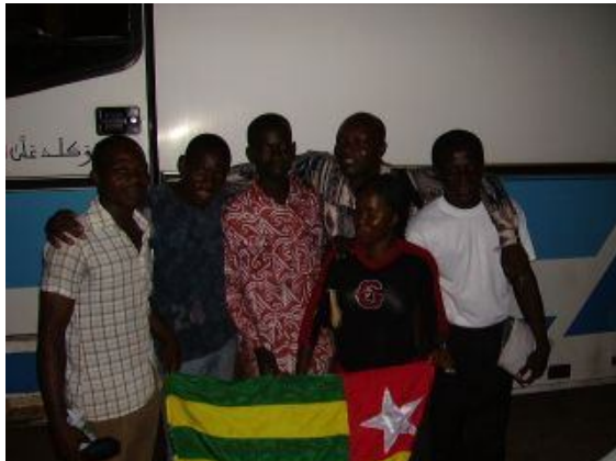
Le départ des participants de 2006

Cinq jeunes togolais membres de l'UCJG TOGO (1 fille et 4 garçons) ont pris part à ce programme.