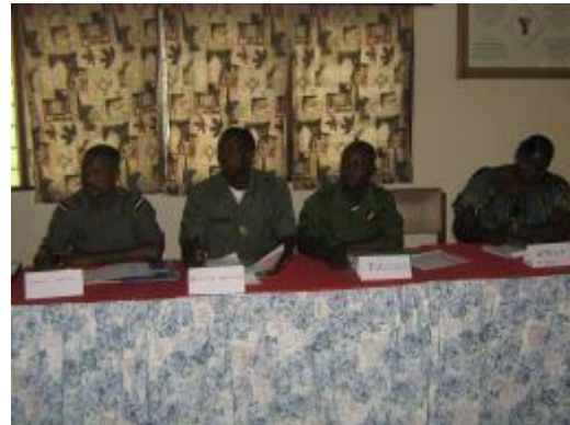
Une vue des participants à l'atelier

participants que la réinsertion commence à partir des lieux de détention, la préparation à l'intégration devrait commencer à partir de ce cadre. Ces ateliers ont permis aux volontaires et au staff d'amorcer une affinité avec le personnel des centres de détentions.