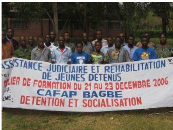
Photo de famille des participants

Le second atelier a eu lieu du 21 au 23 décembre 06 avec pour thème principal « Détention et Socialisation ». Les interventions ont montré aux 25