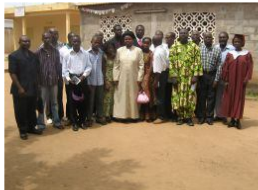
Les participants au culte de clôture autour de Mme le Pasteur de l'Eglise Méthodiste de Wuiti