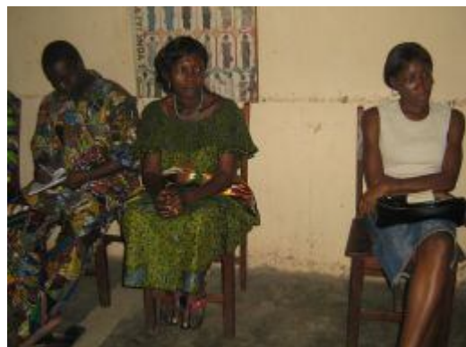
Séance d'étude biblique au siège de YWCA à Kpalimé

Dans le cadre de la commémoration de la semaine internationale de prière et d'amitié YWCA-YMCA ; les UL se sont mobilisées en collaboration avec les membres de UCF/YWCA pour organiser des activités à Lomé, Kpalimé, Sokodé et Bassar. Les temps forts de cette célébration concernent les cultes, les études bibliques et piques.