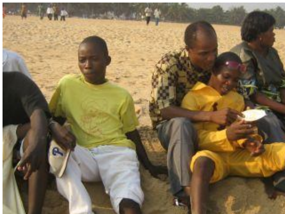
Une sortie à la plage avec les ex détenus

Au niveau du gouvernement : le Gouvernement et Administration Pénitentiaire : Cette initiative renforce les efforts du gouvernement dans le sens d'une amélioration des conditions de vie en prison au Togo, et ils espèrent que le projet sera étendu aux autres prisons dans les années à venir.