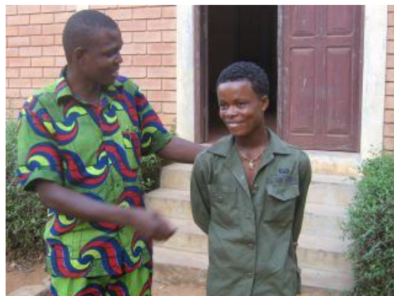
Un jeune en réinsertion avec l'animateur

de cartes, 12 petits postes radios, 1 baby foot et 3 tam-tams ont été livrés.