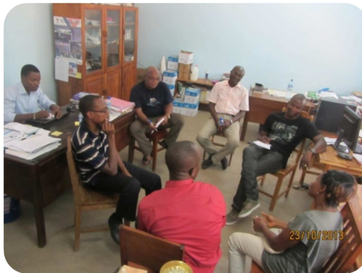
Le Président de YMCA Ghana et le SG de YMCA Liberia en séance de travail avec le staff de programme

Tous les aspects de la vie de YMCA Togo ont été diagnostiqués, notamment la clarté de la mission, la viabilité institutionnelle et la pertinence sociale. C'était aussi l'occasion de partage des bonnes pratiques entre les YMCA participants. Des recommandations ont été