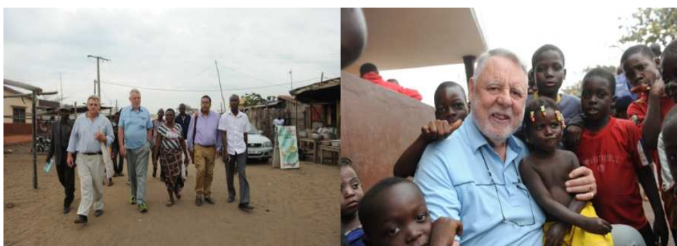
Septembre: accueil d'une délégation de trois personnalités de Y Care International, conduite par son Président fondateur Terry Waite.