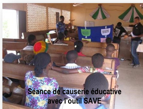
Séance de causerie éducative avec l'outil SAVE

Grâce au soutien financier et technique de UNFPA et en partenariat avec 20 Eglises et 2 Mosquées, 75 pairs éducateurs ont eu à sensibiliser les jeunes de leur communauté confessionnelle de juin à novembre 2013. Cette intervention est la suite des actions entreprises en 2012 dans les mêmes communautés religieuses. A côté de l'éducation faite par les PE à travers les causeries éducatives et les projections de film, des prestataires de soins reçoivent des jeunes référencés par les PE. Des séances de dépistage du VIH, couplées avec des consultations et de soins pour des infections sexuellement transmissibles ainsi que des services de planification familiale ont également été organisées.