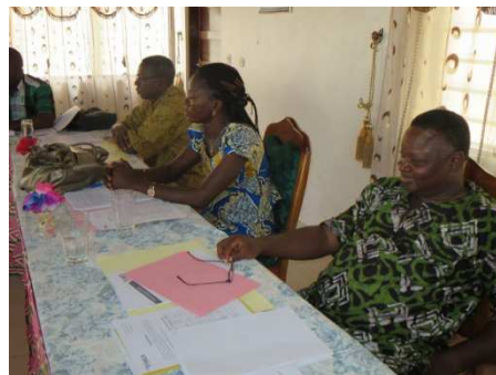
Le CEN lors d'une de ses

Les officiers du CEN se sont retrouvés autant de fois que cela s'est avéré nécessaire pour faire avancer les dossiers en étude à leur niveau.