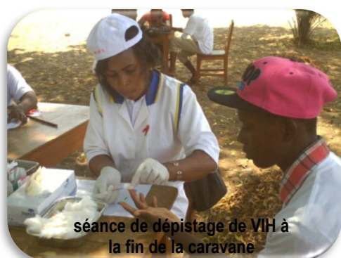
séance de dépistage de VIH à la fin de la caravane

En guise de témoignage, deux pairs éducateurs ayant reçu leurs résultats de dépistage qui est négatif, ont déclaré: « Nous sommes très soulagés car, notre passé nous hantait. Bien que nous faisons des sensibilisations à nos pairs sur cette maladie, au fond de nous-mêmes, nous n'avions pas la paix », avant d'ajouter "Ce projet non seulement nous a rendu sérieuses mais, nous a aussi permis de sauver d'autres filles qui vivent au péril de leur vie ».