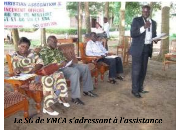
Le SG de YMCA s'adressant à l'assistance

une étude sur les connaissances, attitudes et pratiques des jeunes en matière de la prévention du VIH. Par ailleurs des ateliers partenaires ainsi que les leaders de club de Vie Positives (LCVP) ont été identifiés et sélectionnés. La formation et début des activités d'éducation sont prévus pour janvier 2011.