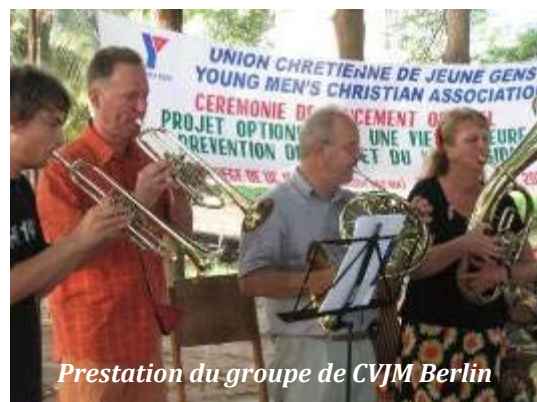
Prestation du groupe de CVJM Berlin

Le projet ambitionne de toucher 1000 jeunes à travers l'éducation par les pairs et des causeries éducatives appuyées de projection de film, distribution de matériel de CCC et de référence des cas vers des structures spécialisées.