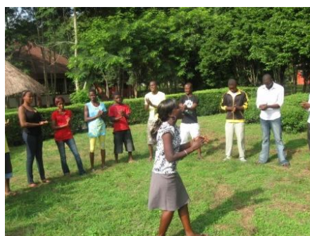
Une séance d'animation en plein air

La cinquantaine de jeunes des deux sexes venus du Mali et du Togo ont participé à des activités telles que des ateliers sur divers thèmes relatifs à la citoyenneté et au leadership, sur l'élaboration de plan d'affaires, sur l'élaboration de CV, lettre de motivation et préparation d'entretien d'embauche.