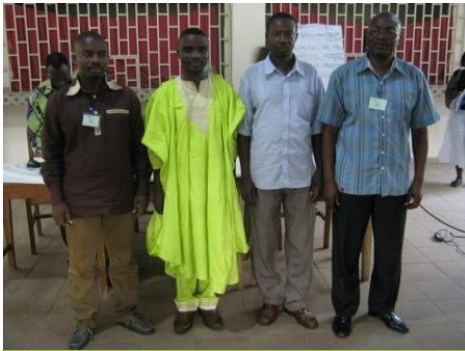
Le président SOWU (4 e à partir de gauche) et les collaborateurs du BEN