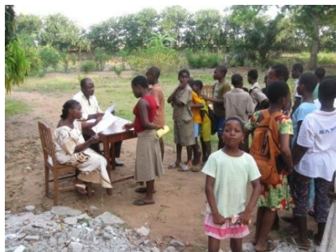
Kermesse : Stand de jeux questions réponses