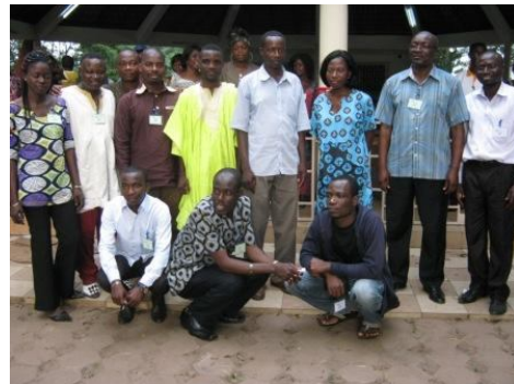
Le Comité Exécutif National