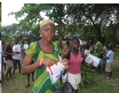
Kermesse distribution de dépliants