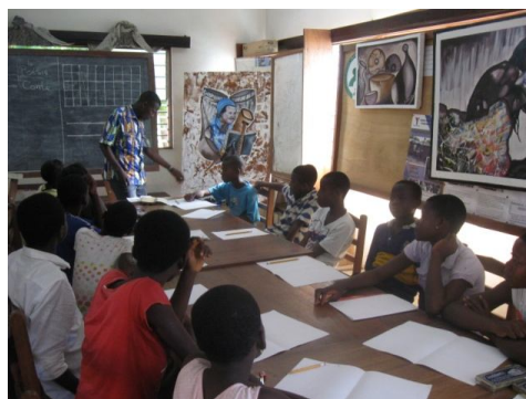
Un atelier d'écriture