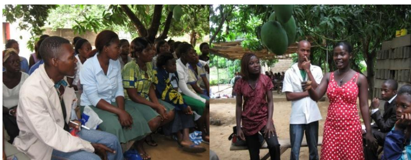
Séance de sensibilisation au centre des apprentis à Adamavo