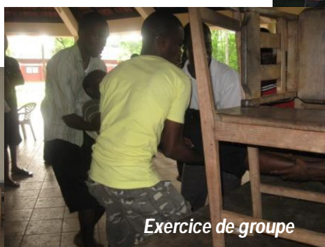
Exercice de groupe