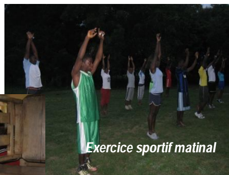
Exercice sportif matinal

Ils ont appris l'art culinaire, organisé des activités sportives et effectué des sorties touristiques.