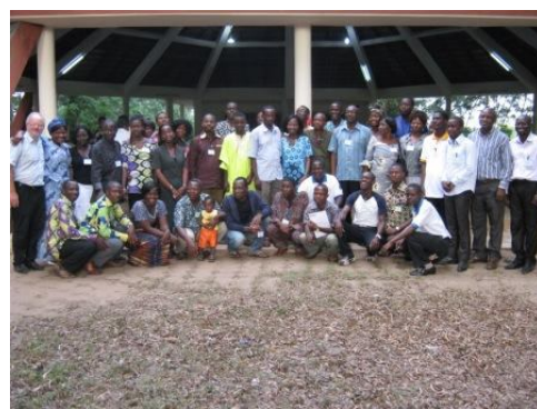
Les participants à l'AG