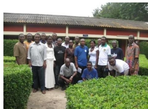
Participants à l'atelier de formation des nouveaux leaders