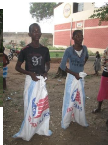
Kermesse : course dans le sac