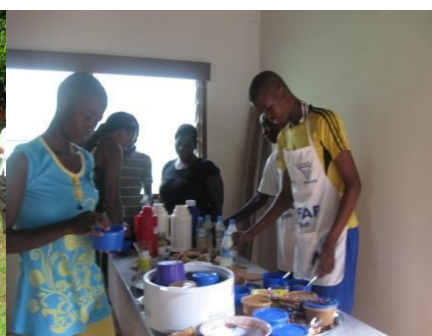
Démonstration d'art culinaire