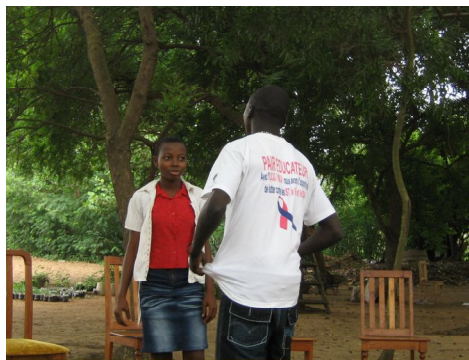
une séance de sketch des PE

La présentation est faite selon le plan suivant :