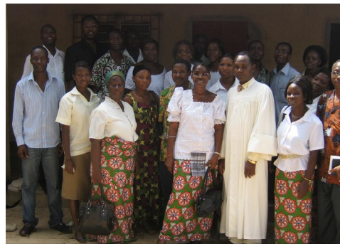
Les participants au culte d'ouverture de la semaine de prière

● La semaine de prière et d'amitié internationale des Alliances mondiales des UCJG/UCF s'est déroulée au Togo du 11 au 17 novembre 2007 conformément au programme établi. Le thème de cette année est : « Priorité aux Enfants ». Cette semaine a été marquée à Lomé et dans les autres régions par les études bibliques, le partage des informations, des exposés débat, des réflexions sur la situation des enfants dans le monde en lien avec les UCJG et les UCF. Toutes ces manifestations ont abouti à l'organisation d'une soirée publique de promotion et de défense des droits des enfants à laquelle l'UNICEF a pris part. Au cours de cette soirée, outre la lecture d'un message des enfants, l'UNICEF a fait une présentation de ses domaines d'intervention en rapport aux enfants.