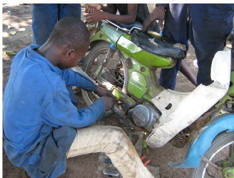
Jeune en réinsertion dans un atelier de mécanique

Le présent rapport porte sur la période janvier décembre 2007. Il est fonction des 2 phases du projet à savoir l'assistance judiciaire et la réhabilitation, et ce en relation avec les 3 sites du projet : la prison civile de Lomé, la prison civile d'Atakpamé et la brigade pour mineurs de Lomé. L'implication des volontaires et les relations tissées en vue de la réinsertion sociale du groupe cible sera également abordée.