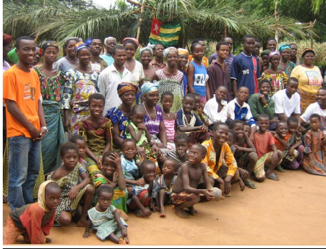
Photo de famille à la fin du camp