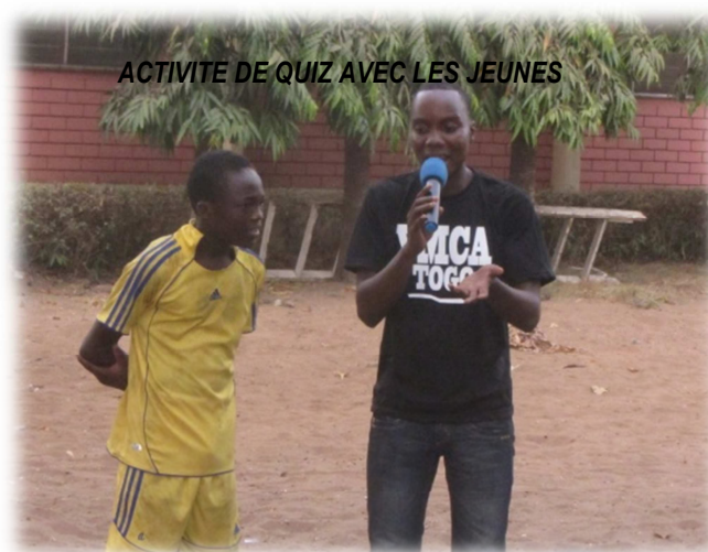
ACTIVITE DE QUIZ AVEC LES JEUNES