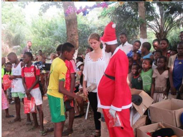
Activité de célébration de Noël 2016 au Centre à Lomé