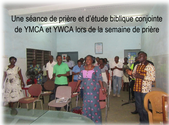
Une séance de prière et d'étude biblique conjointe de YMCA et YWCA lors de la semaine de prière

Les membres des Unions Locales Wisdom, Awatamé, FRAP et Kara apportent leur soutien à l'équipe d'animation aux différents centres de jeunes tous les après-midis des mercredis et vendredis à travers les différentes activités socioéducatives et sportives.