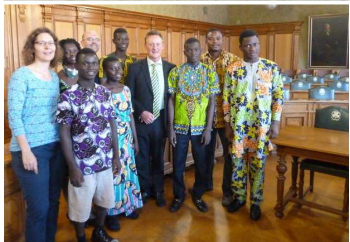
EN HAUT : LA DELEGATION TOGOLAISE AVEC 2 VOLONTAIRES DE CVJM EN BAS : LA DELEGATION TOGOLAISE EN COMPAGNIE DU MAIRE DE FURTH