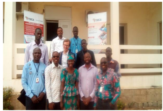
Les participants à l'atelier de Dakar